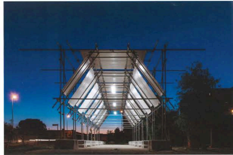
Shelter #1 a Prato, di ECÒL, ha vinto nella categoria Opera su spazi pubblici, paesaggio o rigenerazione.