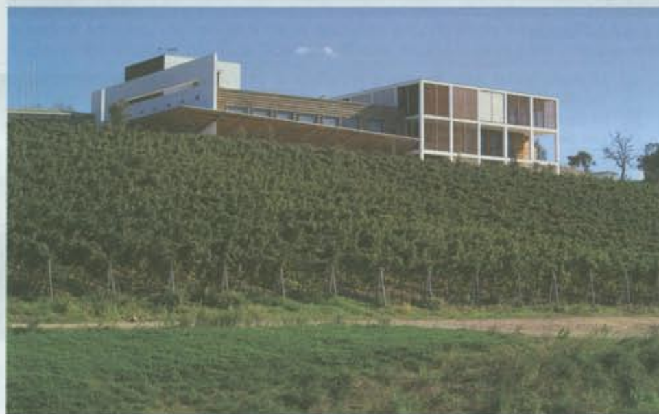
Veduta d'insieme della cantina

La cantina di Collemassari allaccia con la natura uno stretto rapporto sinergico, trasformando il "monumento al vino" in una macchina il cui motore è la natura stessa: i processi naturali di climatizzazione, l'uso di materiali naturali per il contenimento batterico, la luce naturale ottimizzata, le torri del vento per ricambi naturali e per il controllo dell'umidità, l'uso ed il recupero dell'acqua mediante filtrazioni e depurazioni naturali, il contenimento dei campi magnetici mediante schermature a verde, il controllo degli insetti con percorsi interbloccati sono tutti elementi che caratterizzano l'architettura della cantina in un continuo processo di scambio tra interno e esterno col panorama, ma anche con gli eventi atmosferici con la loro capacità di modificare i materiali nel colore e nell'odore. La natura preme dall'esterno verso l'interno ovunque anche sotto terra con la sua roccia.